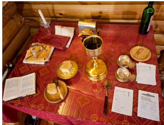
Ehtoollislahjojen valmistelua ennen liturgiaa Salon tsasounassa.