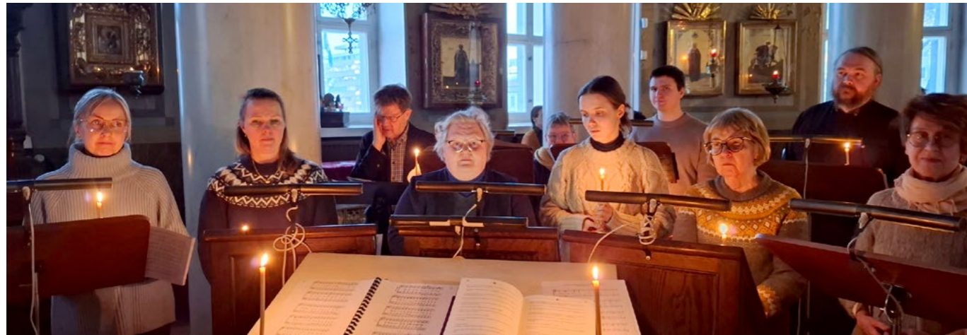
Kirkkokuorolaisia laulamassa katumuskanonia pyhän Aleksandran kirkossa.