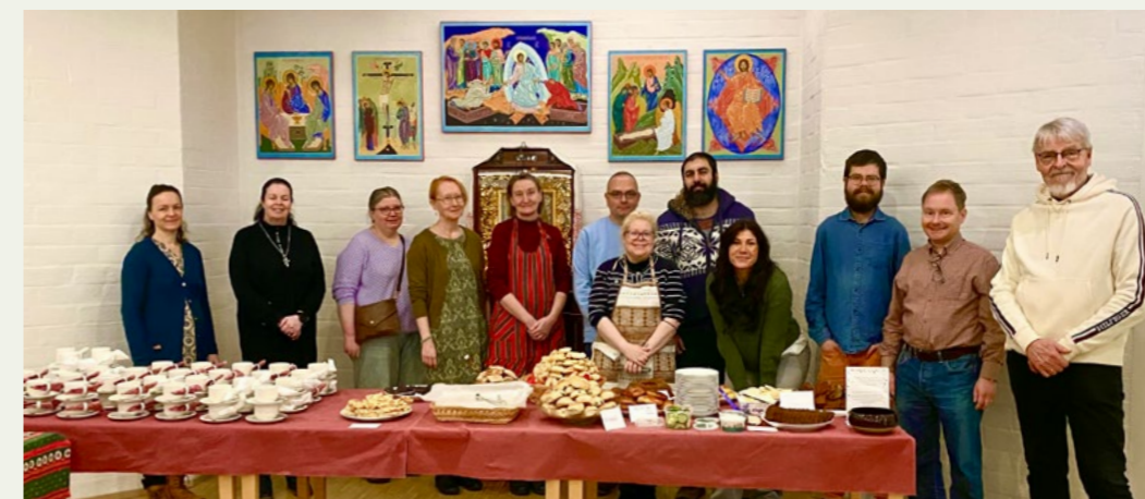
Kuvassa kirkkokahvien järjestämisessä auttaneita katekumeeneja 14.12.