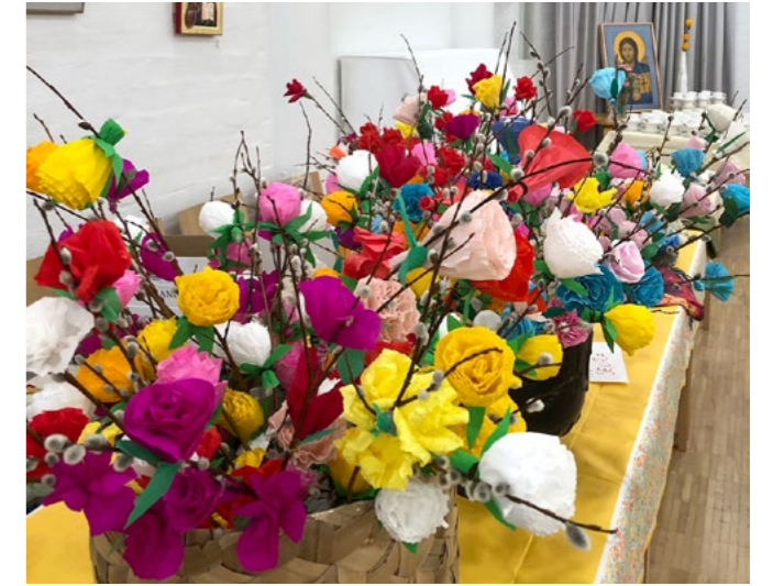
Virpovitsoja pääsiäismyyjäisissä 2025.

Welcome to participate in the activities of the multicultural women's group at Turku Orthodox parish! During spring 2026, we will be organizing church coffee events and sales to raise funds for our trip to Åland (planned for autumn 2026). Upcoming meetings: Tue 24 March, 17:00 at the parish hall: Pisanka egg decorating and preparations for the parish Easter bazaar; Sat 28 March, 10:00-13:00 at the parish hall: Parish Easter