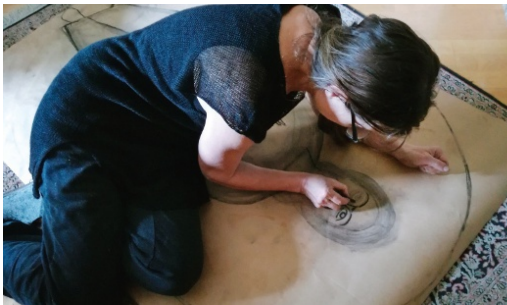
Elizavetalle ikonin maalaaminen on mystinen kokemus, sillä ikonia maalatessa unohtuu hetkeksi oma heikkous.

lan julistusta ja opetusta laudalla. Siksi emme maalaa vain itsestämme. Osa työstä on silti me itse, heikot ja syntiset, joita ilman ikonia ei ilmesty. Nämä kolme asiaa ovat ikonin kolminainen liitto.