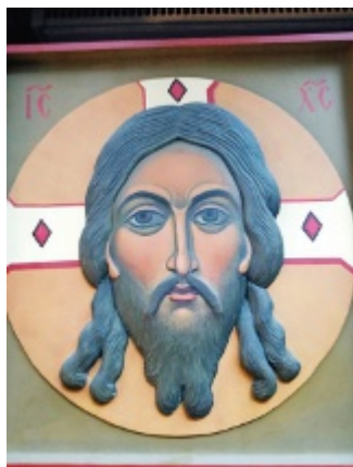
Elizavetan veistokoneita on tällä hetkellä nähtävissä neljässätoista maassa kulkevassa näyttelyssä.

- Emme voi maalata ilman uskoa. Edessämme on ikivanha perinne ja teologia, joka maalaataan kuvaksi. Ikonista tulee Juma-