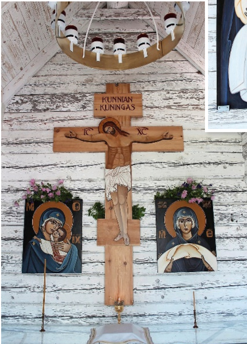
Tsasounan alttariseinällä Kristus ristillä