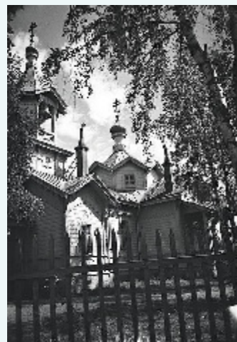
Pyhän Nikolaoksen kirkko 1950- luvun alussa.

Kreikkalais-katolinen oppi näil- lä seuduin ei ole eilispäivän tuo- ma. Se on tällä paikkakunnalla ja ympäristöillä, samoin kuin ko- ko Karjalassakin, ollut tunnet-