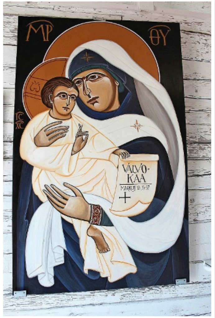
Rasimäen Jumalanäiti, kylän suojeluspyhä