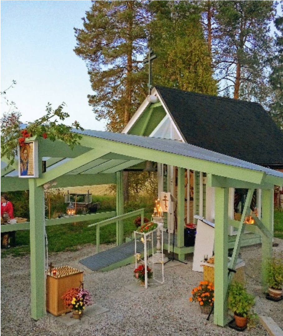
Pyhän Ristin ylentämisen ja Pyhän Johannes Krysostomoksen tsasouna Rasimäen Erakkolassa

"Siunattu olkoon hän, joka tulee Herran nimeen."