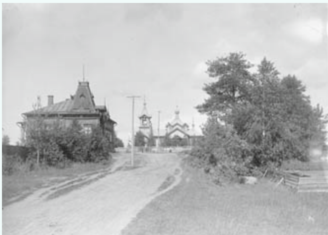
MUSEOVIRASTON KUVAKOELMA FINNA