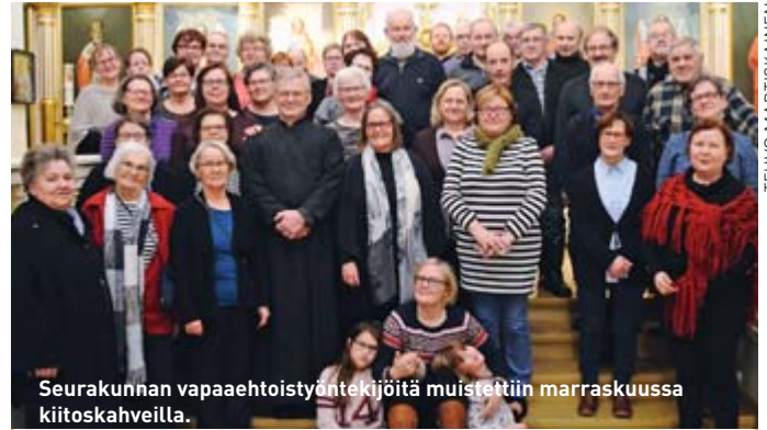
Seurakunnan vapaaehtoistyöntekijöitä muistettiin marraskuussa kiitoskahveilla.

Tapahtumalla on säävaraus. Seuraa ilmoittelua seurakunnan netisivuilla ja Pogostan Sanomissa.